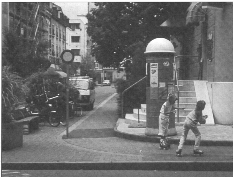
La Bärenfelsenstrasse à Bâle a été la première rue résidentielle réalisée en Suisse.