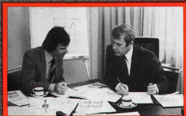
Das EgoKiefer Beratungsteam besteht aus geschulten Spezialisten, welche die Bedürfnisse des Bauherrn und die Vorschriften des Architekten zu optimalen Lösungen für Fenster und Fassaden vereinen.

Wir konstruieren, testen, produzieren, verkaufen, montieren Fenster und Türen!