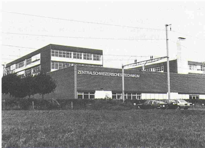
Das Zentralschweizerische Technikum in Horw