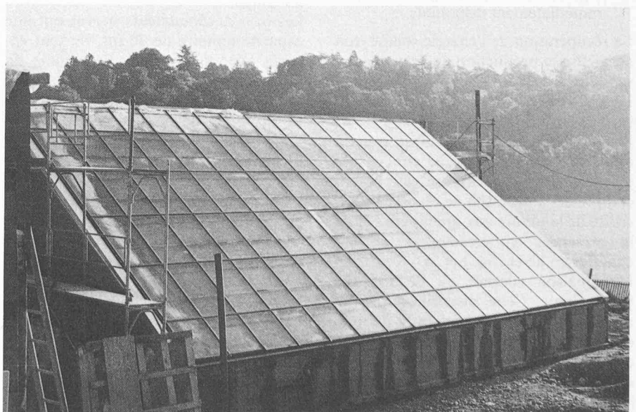
Fig. 2. — Capteur solaire.

e) surface de toiture: 500\ \text{m}^2 .