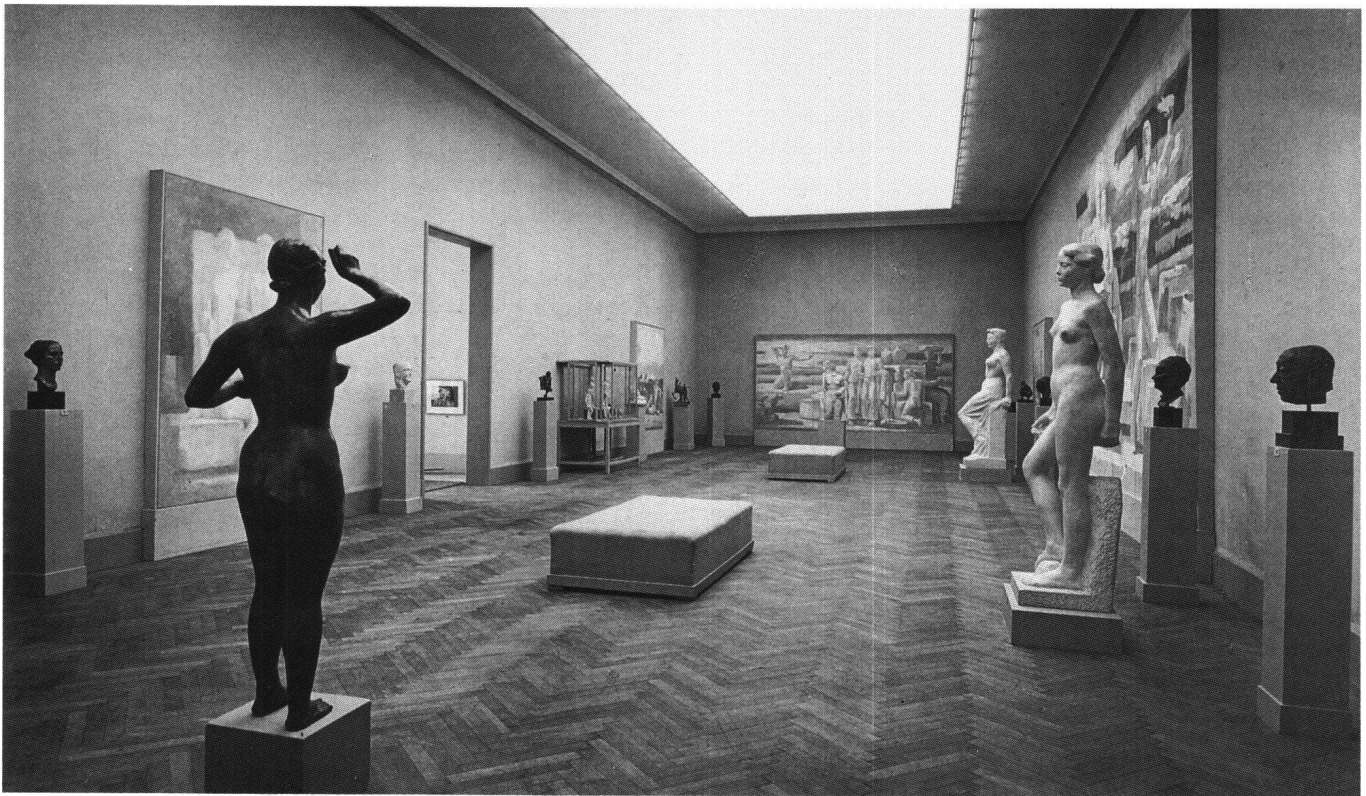
Abb. 2 Ausstellung mit Werken von Charles Otto Bänninger und Karl Walser im Schweizer Pavillon anlässlich der Biennale von Venedig 1942.

schaftlichen Beziehungen zwischen Italien und der Schweiz beitragen möge.» 10 Diese freundschaftlichen Beziehungen, wie auch der Erfolg, der Hermann Hubacher durch die Verleihung des Mussolini-Preises zuteil wurde 11 , führte das Eidgenössische Departement des Innern als Begründung an, als es dem Bundesrat Antrag stellte, auch die Einladung zur Biennale von 1940 wiederum anzunehmen. Die Wahl der Kommission für die Schweizer Biennale-Vertretung fiel auf Alexandre Blanchet, Louis Moillet und auf Karl Geiser. Die Einladung an Geiser war an die Bedingung geknüpft, dass die beiden grossen Bronzegruppen vor dem städtischen Gymnasium im Berner Kirchenfeldquartier 12 ausgestellt werden sollten. Da dies nicht möglich war, ging die Einladung an den Bildhauer Jakob Probst.