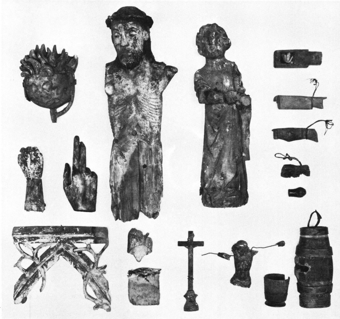
Abb. 1 Zusammenstellung aller Funde im Beinhaus von Naters (November 1985). Einheitlicher Massstab 1:5.