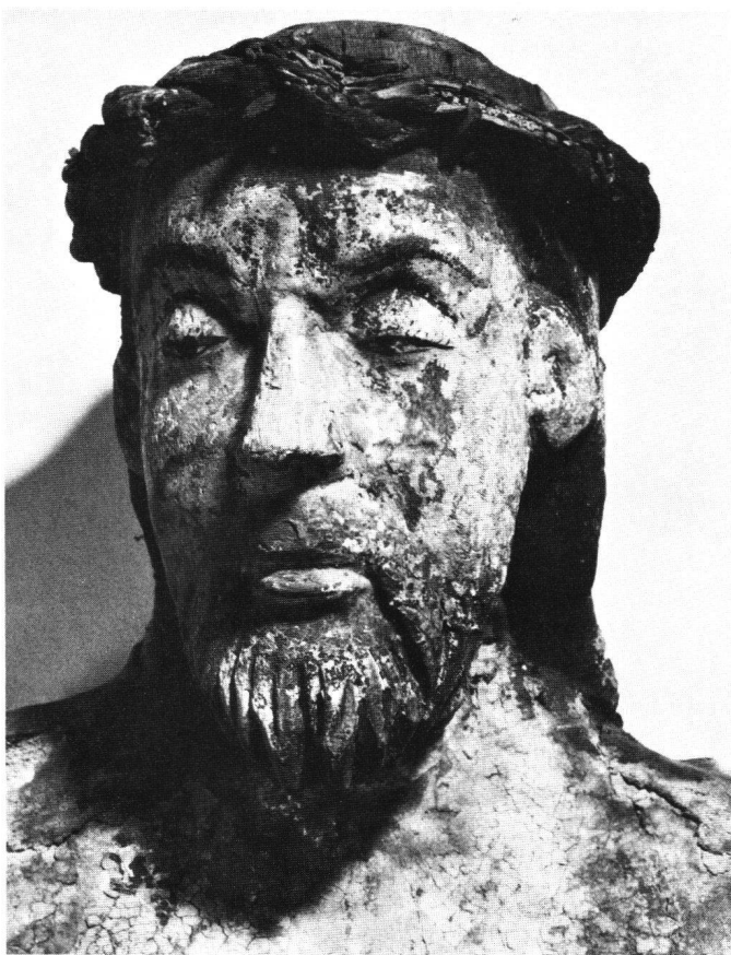
Abb. 8 Kopf des Kruzifixus von vorne.