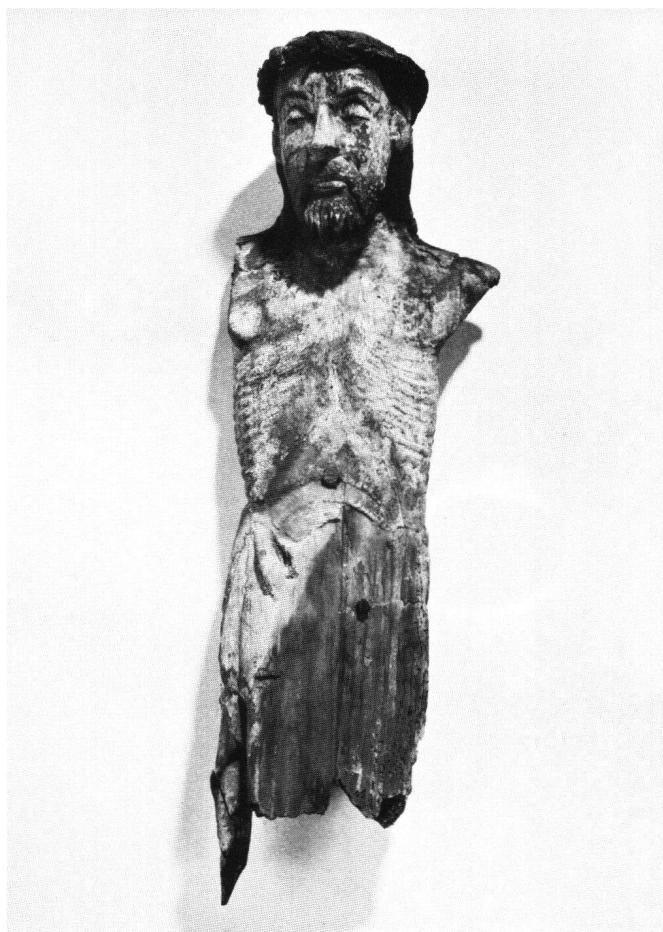
Abb. 5 Fragment eines Kruzifixus, um 1390. Höhe 54 cm.

deckt und mit einem Tüfengehänge über den linken Vorderarm lappt. 10 Aus dieser Raffung erklären sich die Schüsselfalten unter dem rechten Vorderarm sowie der schmale vertikale Faltenfächer daneben. Auffallend ist das lineare Spiel geschwungener Säume bei Tüfengehängen, ehemals wohl noch gesteigert durch den Farbwechsel von Vorder- und Innenseite des Gewandes. In der Profilansicht des Tüfengehänges unter dem linken Arm erhält dieses dekorative Motiv durch die Parallelführung der Säume sogar Monumentalität. Am Rücken fällt der Überwurf in grosszügigen Längsfalten, die unten knickend ausladen. Die Locken des Hinterhauptes sind sorgfältig geschnitten (Abb. 2c).