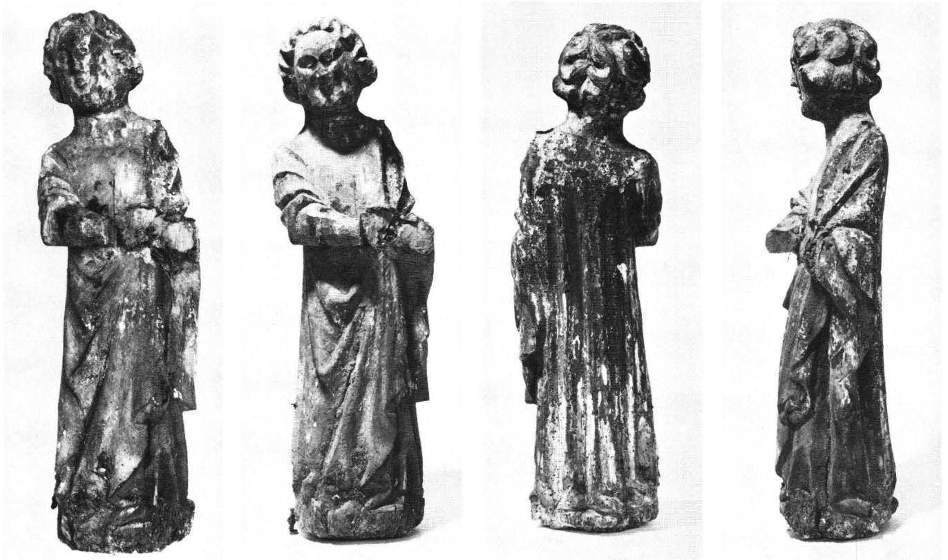
Abb. 2 a-d Verschiedene Ansichten des Engels, um 1330/40. Höhe 48,5 cm.