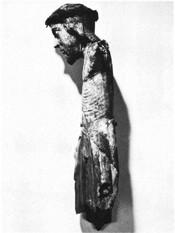
Abb. 9 Der Kruzifixus im Profil von links.

10. Schatulle mit Schiebedeckel. Holz. Länge 9,5 cm. Entstehungszeit kaum bestimmbar. Zum Aufbewahren der kleinen Wassertesseln. 17