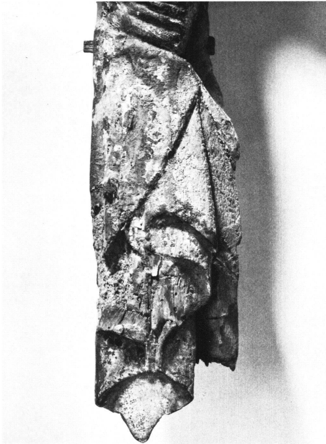
Abb. 6 Drapierung des Lendentuchs beim Kruzifixus.