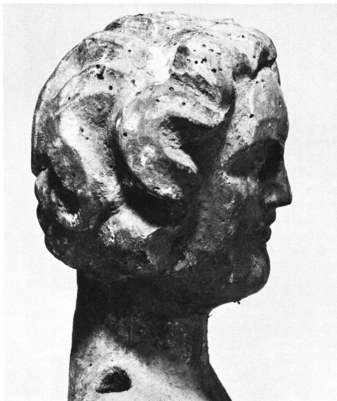
Abb. 4 Kopf des Engels im Profil.

Die Figur ist merklich nach links gekrümmt, wobei das Haupt die Krümmung noch betont; zugleich ist der Körper auch sanft nach hinten gebogen. Im rundlichen Haupt, das auf breitem Hals sitzt, scheinen Mund, Nase und Augen störend eng zusammengedrückt (Abb. 3). Das Haupthaar ist entlang der Schläfe und den Wangen in einer damals verbreiteten Art 9 frisiert; ein «Lockenmäander» zeichnet die modische Ohrlocke (des frühen 14. Jahrhunderts) zwar deutlich, lässt sie aber nicht als beherrschendes Motiv hervortreten (Abb. 3+4). Nach der Stellung der Arme zu schliessen, könnte der Engel eine Ampel oder ein Weihrauchfass getragen haben. Der Mantel bzw. der Überwurf ist um den rechten Oberarm geschlungen; an der linken Körperseite wird er hochgezogen, so dass er die Schulter