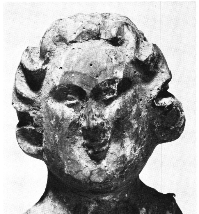
Abb. 3 Kopf des Engels. Man beachte das enge Zusammenrücken von Augen, Nase und Mund, ferner den das Haupt einfassenden «Lockenmäander».