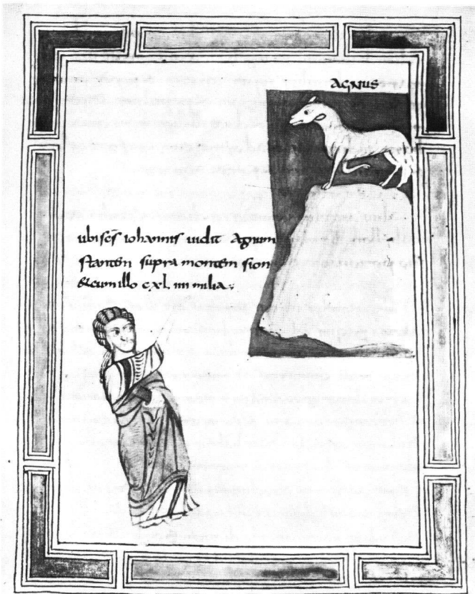
Abb. 4 Lamm auf dem Berge Sion (Apc XIV, 1). Valenciennes, Bibliothèque Municipale, Ms. 99, fol. 27r.