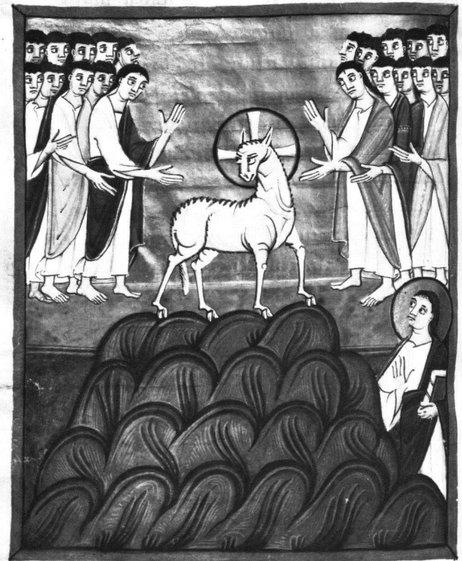
Abb. 5 Lamm auf dem Berge Sion (Apc XIV, 1). Bamberg, Staatsbibliothek, Msc. bibl. 140, fol. 34v.

Fragment der Christus-Engel mit dem «Evangelium» genau unterhalb des Christus-Lammes auf dem Berge Sion, dessen welliger Umriss der schollenartigen Standfläche des Engels gleicht. Die in der Auslegung des APTPERTUS vollzogene Gleichsetzung von Lamm und Evangelium-Engel kommt also auf dem Basler Blatt in mehrfacher Hinsicht zum Ausdruck.