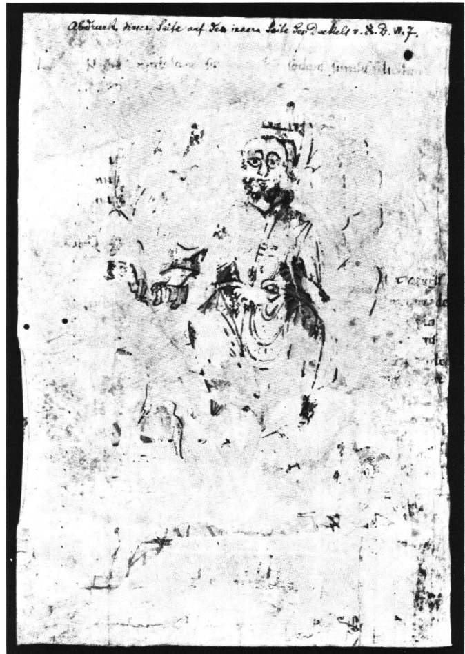
Abb. 2 Menschensohn auf der Wolke (Apc XIV, 14–15). Basel, Öffentliche Bibliothek der Universität, Ms. N.I.4 Blatt C, Verso.

Vor nahezu einem Jahrzehnt veröffentlichte CARL NORDEN-FALK 1 das Fragment einer frühmittelalterlichen illustrierten Apokalypse der Bayerischen Staatsbibliothek zu München (Cm 29270/12, olim Cm 29159), ein Fragment, das er zu Recht der gleichen Überlieferung zuordnete, zu der auch die karolingische Apokalypse in Valenciennes (Bibliothèque Municipale, Ms. 99) 2 und die bekannte ottonische Apokalypse in Bamberg (Staatsbibliothek, Msc. bibl. 140) 3 gehören. Derselben Familie lässt sich nun auch ein weiteres Fragment hinzufügen, das unter der Signatur Ms. N.I.4