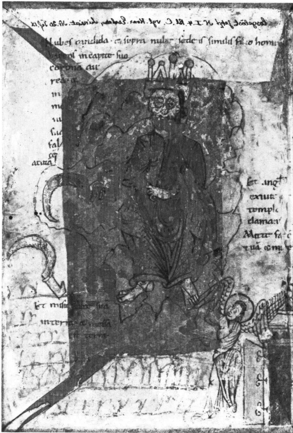
Abb. 8 Menschensohn auf der Wolke (Apc XIV, 14-15). Basel, Öffentliche Bibliothek der Universität, Deckel der Inkunabel X D.VI.7. Abdruck der Versoseite des Apokalypse-Fragments (Abbildung spiegelverkehrt).