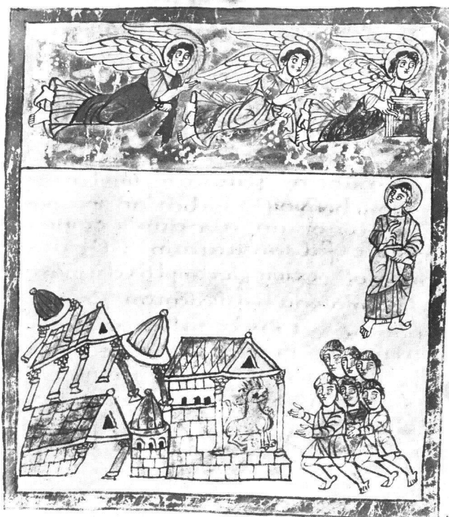
Abb. 10 Engel mit dem ewigen Evangelium (Apc XIV, 6–9). Trier, Stadtbibliothek, Cod. 31, fol. 45r.

Illustration im Prototyp unserer Familie II einigermaßen genau rekonstruieren: der Seher Johannes war wie in Trier rechts unten plaziert (nicht links unten wie in Valenciennes/Paris); das Lamm war ohne Kopfwendung nach links gerichtet, und die Auserwählten standen seitlich neben dem Berg (beides in Bamberg abgeändert); die «virgines» und das Kreuz auf der Vorderseite des Berges in Basel waren noch nicht vorhanden. Insgesamt vermitteln die sich ergänzenden Versionen von Bamberg und Basel eine wesentlich getreue Vorstellung von der ursprünglichen Illustration des Prototyps als die Variante von Valenciennes/Paris.