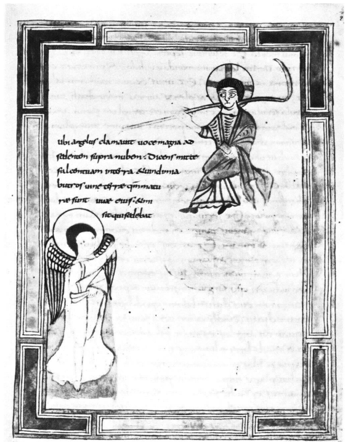
Abb. 9 Menschensohn auf der Wolke (Apc XIV, 14-15). Valenciennes, Bibliothèque Municipale, Ms. 99, fol. 29r.

beiden genannten Freskenzyklen keine Vergleichsszenen zu unserem Basler Fragment, aber die entsprechenden Illustrationen der Apokalypsen von Valenciennes, Paris und Bamberg sind derart verwandt, dass an der Zugehörigkeit des Basler Blattes zu dieser Familie kaum gezweifelt werden kann.