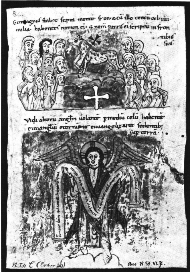
Abb. 1 Lamm auf dem Berge Sion (Apc XIV, 1) – Engel mit dem ewigen Evangelium (Apc XIV, 6–9). Basel, Öffentliche Bibliothek der Universität, Ms. N.I.4 Blatt C, Recto.