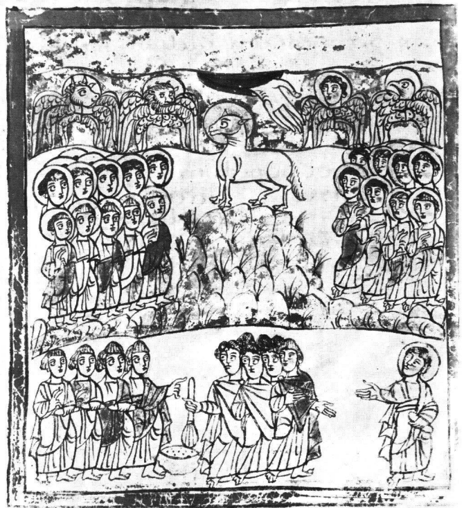
Abb. 3 Lamm auf dem Berge Sion (Apc XIV, 1–3). Trier, Stadtbibliothek, Cod. 31, fol. 43r.

Auf der unteren Hälfte derselben Seite (Abb. 1) verkündet – vor ebenfalls mattvioletterm Grund – der Engel mit dem «evangelium aeternum» das Nahen des göttlichen Gerichts (Apc XIV, 6–7). Er trägt über blassgelber Tunika einen rotbraunen Mantel, seine Flügel sind hellgrün. Er hält eine geöffnete Rolle, auf der die Worte seiner Warnrufe geschrie-