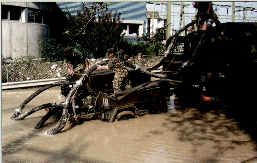
Löschwasserpumpen im Einsatz.

Im Zentrum stand der Einsatz von schwerem Material wie Kipper, Bagger, Brückenmaterial und der Einsatz von Helikoptern wie bei der Errichtung der Luftbrücke von Buochs nach Engelberg. Dazu kam eine grosse Menge an Material, das von der Logistikkbasis der Armee an die Kantone abgegeben wurde.