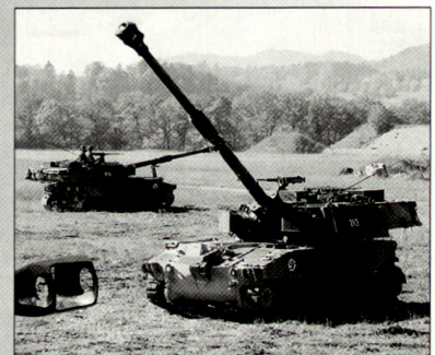
Die Artillerie – die Schwergewichtswaffe für den Feuerkampf auf der taktischen Stufe.