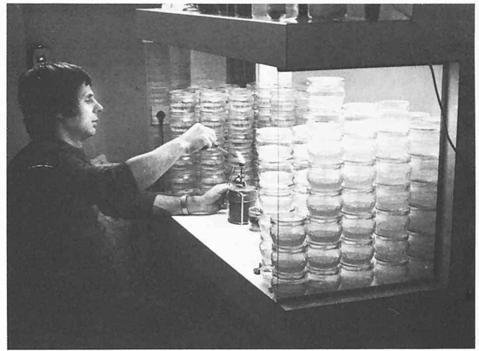
In einer «Impfkammer» werden kleine Pflanzen oder Sprosssteile, die in Gläsern auf Nährmedien gezüchtet werden, mit Agrobakterien infiziert. Anders als im Gewächshaus wird hier unter sterilen, kontrollierten Bedingungen gearbeitet und ein Befall der Versuchspflanzen durch andere Mikroorganismen verhindert

Das zweite Ziel ergibt sich aus der Tatsache, dass Pflanzen ihre Speicherproteine zunächst für ihren eigenen Gebrauch bilden, und das deshalb die Zusammensetzung dieser Proteine nicht immer ideal für die menschliche Ernährung ist. So enthalten beispielsweise Mais-Proteine zu wenig Lysin und Methionin, beides sogenannte essentielle Aminosäuren, die der Mensch nicht selbst synthetisieren kann und deshalb mit der Nahrung aufnehmen muss: Ist er, wie etwa in südamerikanischen Ländern, auf Mais als Hauptnahrungsmittel angewiesen, dann drohen ihm Mangelkrankheiten.