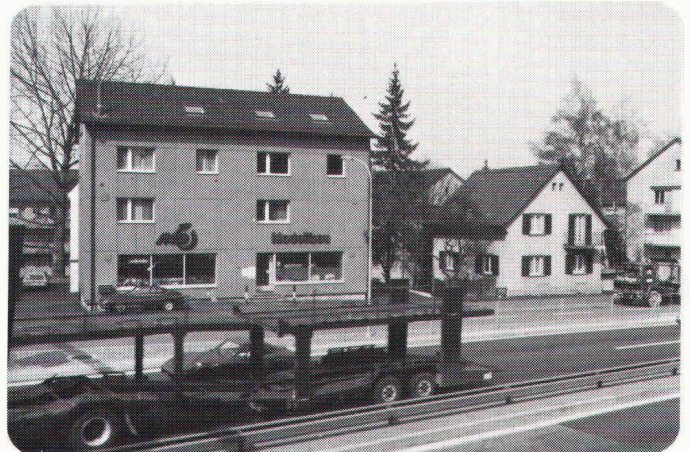
CARDOPHON®-EXTRAPHON Wohn- und Geschäftshaus an der Überlandstrasse, Zürich