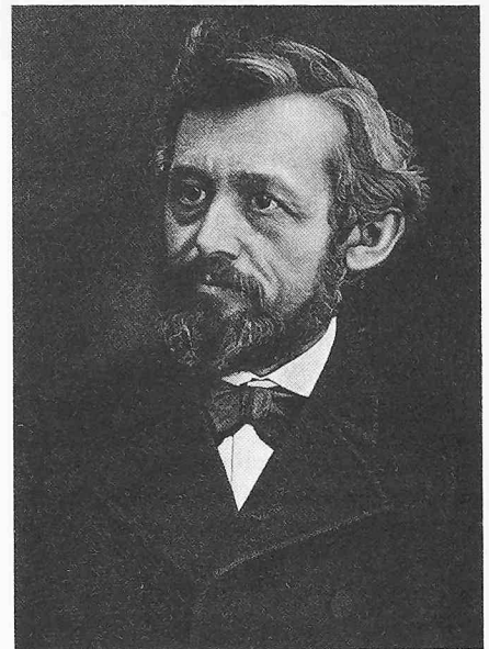
Carl Culmann (1821-1881), aus Festschrift zur Feier des fünfzigjährigen Bestehens des Eidg. Polytechnikums

«In Italien erscheint die graphische Statik am würdigsten und besten vertreten» ...