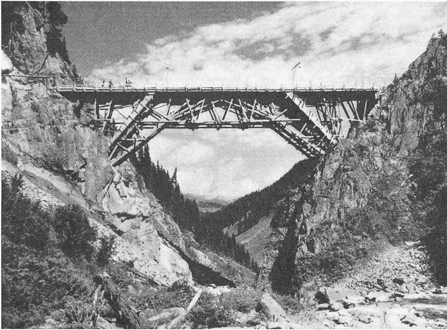
Bild 13. Lehrgerüst Val Nalps, im Freivorbau erstellt