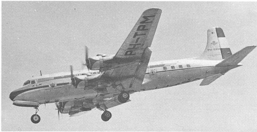
Fig. 7. — Comme le DC-1, le DC-4 s'est révélé capable de développements conduisant à la naissance de toute une série de types. Ici, le DC-6A, à cabine pressurisée.

rie de types plus grands, plus rapides et plus puissants en a été développée, soit les DC-6 et les DC-7, chacun comportant différentes versions, toutes équipées de cabines pressurisées, contrairement au DC-4.