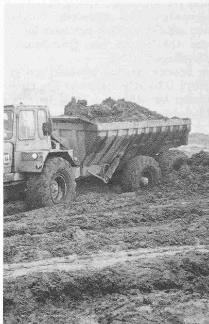
Bild 1. Auffüllarbeiten bei nassem Wetter

Durch die Untersuchungen sollen die Möglichkeiten und Grenzen der Tieflockerung bei der Sanierung von verdichteten Böden abgeklärt werden. Unter der Tieflockerung versteht man das Auflockern einer mindestens 40 bis 60