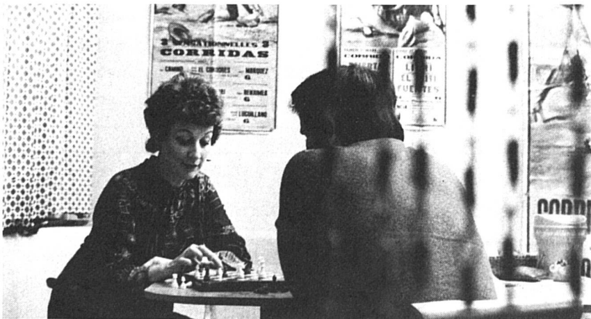
Echecs : Femmes Suisses est toute contente d'annoncer la naissance du « Centre d'échecs féminin ». Local : Brasserie de la Fontenette, 33 route de Veyrier à Carouge.