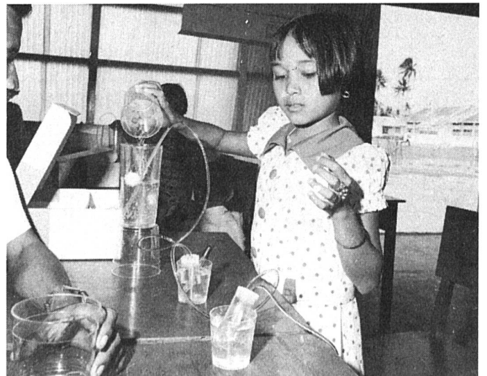
La participation des enfants à leur année : tout est possible.