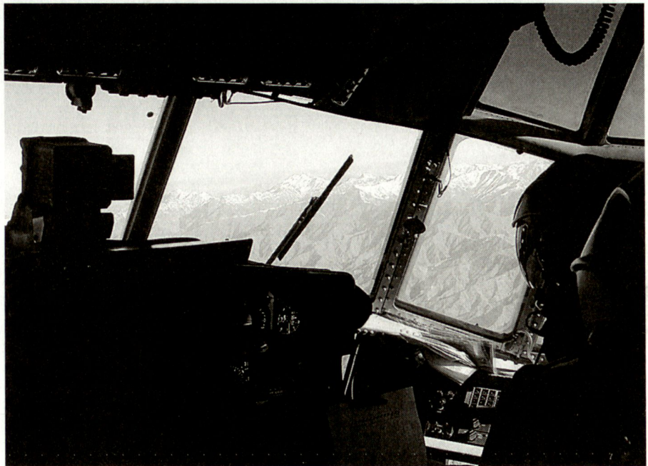
Eine C-130 Hercules überquert das Hindukusch-Gebirge, welches Afghanistan teilt.

Das Jahr 1999 stellte einen Wendepunkt in der Ausrichtung der schwedischen Verteidigungspolitik dar. Auf europäischer Ebene gab es zwei Ereignisse, welche auch Schweden nicht unberührt liessen. Erstens brachte die Kosovokrise die veralteten Verteidigungsstrukturen Europas zu Tage. Zweitens gelangten die EU-Mitgliedstaaten am Europäischen Rat in Köln zur ge-