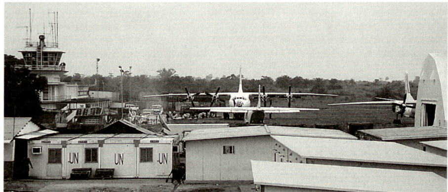
Von Juni 2003 bis Juni 2004 betrieb eine schwedische Flughafeneinheit den Flughafen in Kindu. Dies war ein äusserst wichtiger Beitrag an die Operation MONUC in der Demokratischen Republik Kongo.