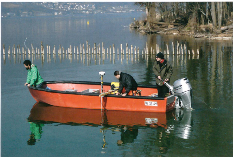
Abb. 2: Sutz-Lattrigen, Rütte. Mit dem Echolot wird der Seegrund vermessen.

Seit 2011 ist die neolithische Fundstelle Sutz-Lattrigen, Rütte, Teil des UNESCO-Welterbes «Prähistorische Pfahlbauten um die Alpen». Damals startete ein Projekt zum Schutz der teilweise gut erhaltenen archäologischen Schichten, die nach ersten dendrochronologischen Ergebnissen in die Zeit von 2763 bis 2646 v. Chr. datieren.