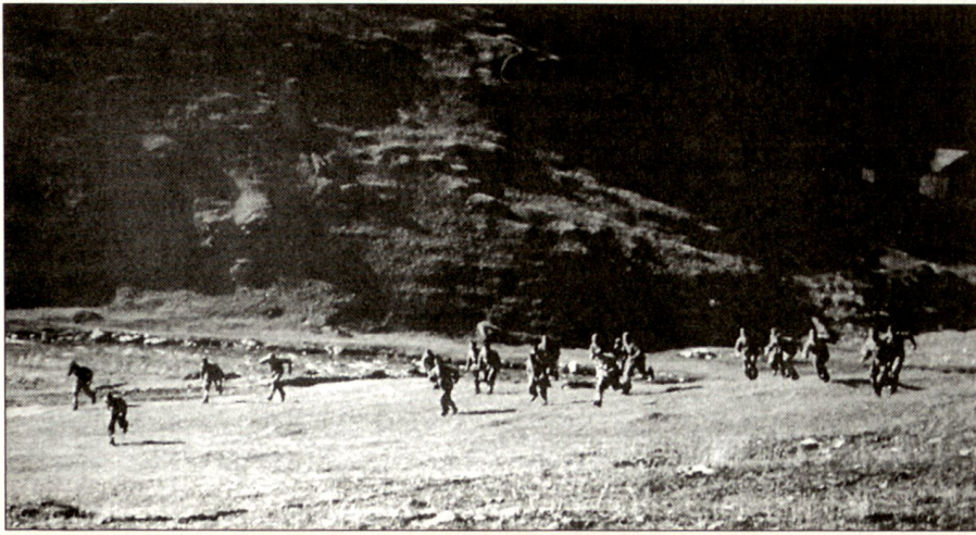
Polnische Internierte bei der Formationsschulung auf dem Valsenberg 1942.