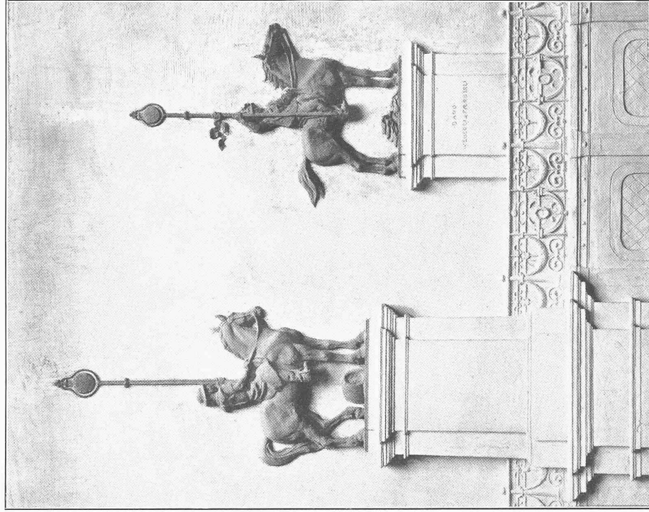
Strompfeiler der Kleinbasler-Seite.