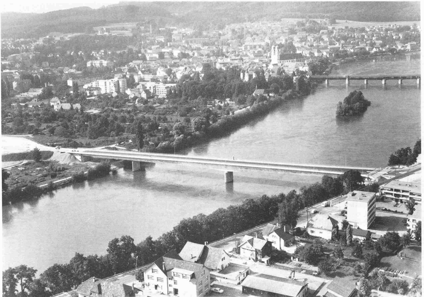
Bild 1. Flugaufnahme der vollendeten Brücke