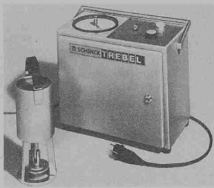
Tragbares Zugprüfgerät RAB für die Prüfung von verschiedensten Baumaterialien auf der Baustelle und im Laboratorium

Die Versuchstechnik erlaubt Prüfungen an den verschiedensten Baumaterialien, Kunststoffen und an Teilen der Beschichtungs- und Befestigungstechnik. Wird das Zugprüfgerät RAB im Labor verwendet, kann es mit einer elektronischen Kraftmesskette mit Digitalanzeige und Maximalwerterkennung ausgestattet werden. Über einen Schreiberanschluß können Kraft-Zeit-Verläufe aufgezeichnet werden.