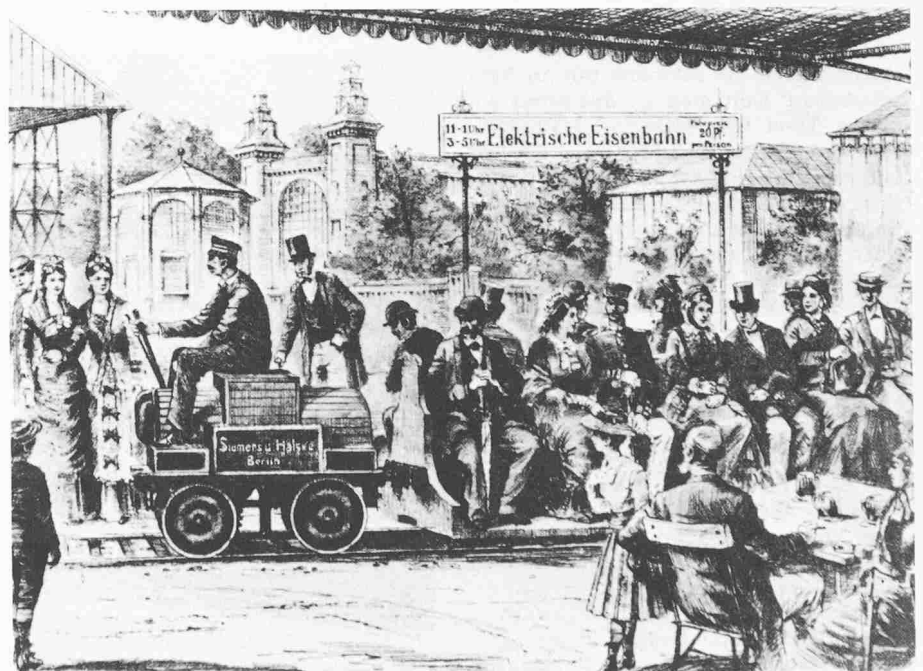
Auf dem Gelände der Berliner Gewerbeausstellung setzte sich am 31. Mai 1879 zum erstenmal ein Schienenfahrzeug mit Hilfe von Strom und Elektromotor in Bewegung. Werner von Siemens hatte diese erste elektrische Lokomotive der Welt konstruiert. Sie zog drei kleine sechssitzige Wagen über eine 300-Meter-Rundstrecke. Der geglückten Premiere vom 31. Mai folgten während der Dauer der Ausstellung noch rund 5000 weitere Fahrten