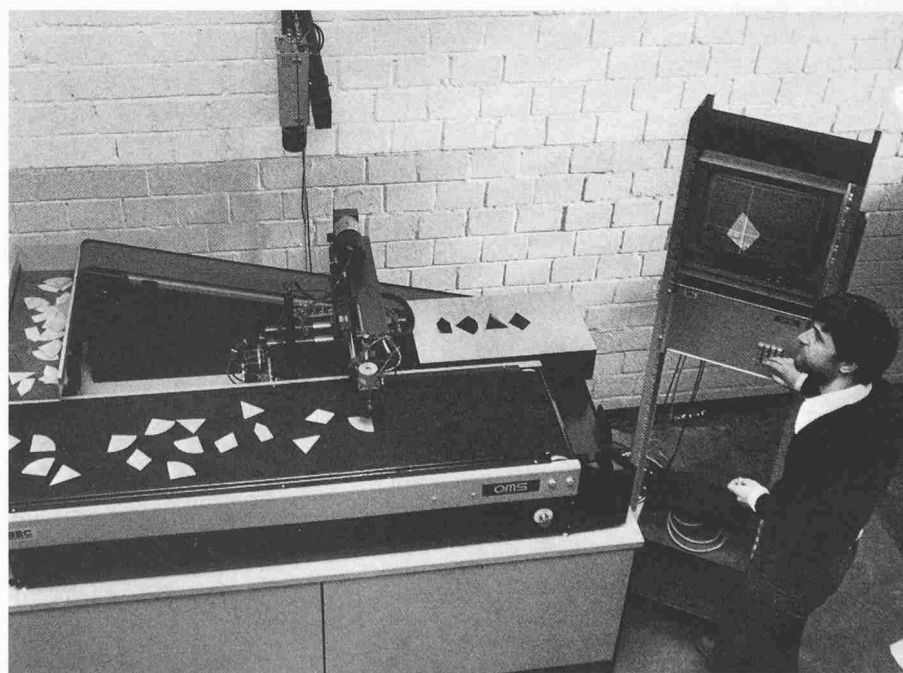
Das «Auge» des Roboters ist eine Fernsehkamera (oben), das «Gedächtnis», das die Stanzteile auf dem Fließband identifiziert, ein Mikroprozessor (rechts), sein Arm ein Manipulator, der die Teile ergreift und so genau über die entsprechenden Löcher des Ablagekastens hält, dass sie hineinfallen können

Fachleute sehen Verwendungsgebiete dieser