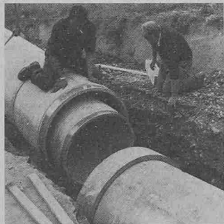
Das Verbinden der Doppelrohre im Graben. Die Konzentricität der beiden Rohre in der Einbaulage wird durch zwei Auflagerplatten gewährleistet, die an der Kupplung des Innenrohres angebracht sind

wasserqualität des Pumpwerkes durch die Kläranlage ungünstig beeinflusst werden könnte.