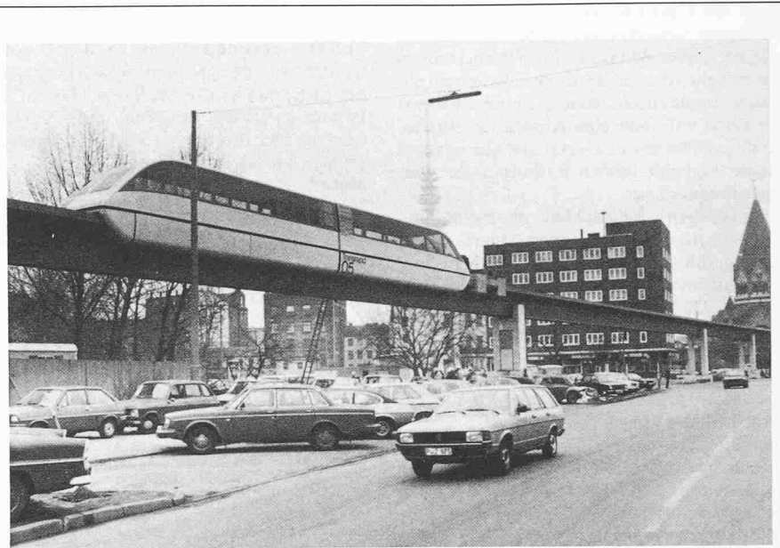
Die Magnetschwebbahn «Transrapid 05» ist eine der Attraktionen der Internationalen Verkehrs-Ausstellung «IVA '79» vom 8. Juni bis 1. Juli in Hamburg. Die Bahn, die auf einer 900 Meter langen Demonstrationsstrecke zwischen dem Messehauptingang Jungiusstrasse und dem Freigelände Heiligengeistfeld verkehrt, besteht aus zwei je 13 Meter langen Triebwagen, wiegt insgesamt 36 Tonnen und kann 68 Fahrgäste befördern. Die Anlage wird mit Förderung des Bundesministers für Forschung und Technologie von der Projektgruppe IVA der Firmen Krauss-Maffei + Messerschmitt-Bölkow-Blöhm (MBB) und Thyssen Henschel errichtet.

(AD) Die beiden «Fenster» in der Erdatmosphäre für elektromagnetische Wellen, die von Himmelskörpern und anderen kosmischen Objekten ausgesandt werden und zu uns gelangen können, stellen nur einen relativ kleinen Ausschnitt aus dem Spektrum dar. Es handelt sich um das sog. optische Fenster für sichtbares Licht und das – wesentlich breitere – Radiofenster, über das die Radioteleskope Strahlung aus dem Weltraum empfangen. Der Grossteil fällt jedoch der atmosphärischen Absorption durch Ozon, Wasserdampf, Kohlendioxid und andere Moleküle zum Opfer. Und Wellen niedriger Frequenz jenseits des Radiofensters, d. h. Wellen von mehr als 20 m Wellenlänge, werden durch die Ionosphäre abgeschirmt. So war es bisher nur mit Raketen sonden und Forschungssatelliten von Positionen aus dem Kosmos auch in den von der Erdoberfläche aus nicht zugänglichen Frequenzbereichen zu erfassen. Die Erkenntnisse, die man in relativ kurzer Zeit damit gewinnen konnte, haben das «Weltbild» der Astrophysik bereits wesentlich verändert und erweitert.