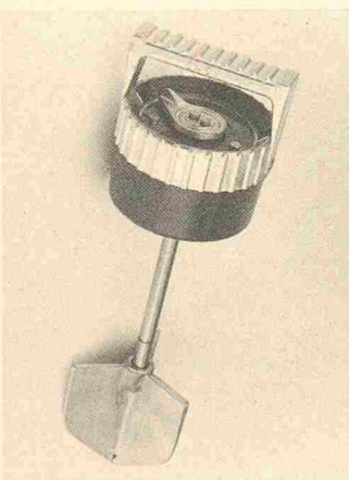
Konsistenzmessgerät Plastimeter P 86

messen werden kann in jedem Gefäss, direkt im Mischer, in einem Betonkübel, in einer Pflastermulde, in der Schalung oder auch in einem auf den Boden geschütteten Haufen. Der Plastimeter P 86 ist geeignet für die Konsistenzen K 2 und K 3 und gibt dem Verdichtungsmaß auch nach Walz und dem Setzmaß nach Abrams vergleichbare Resultate.