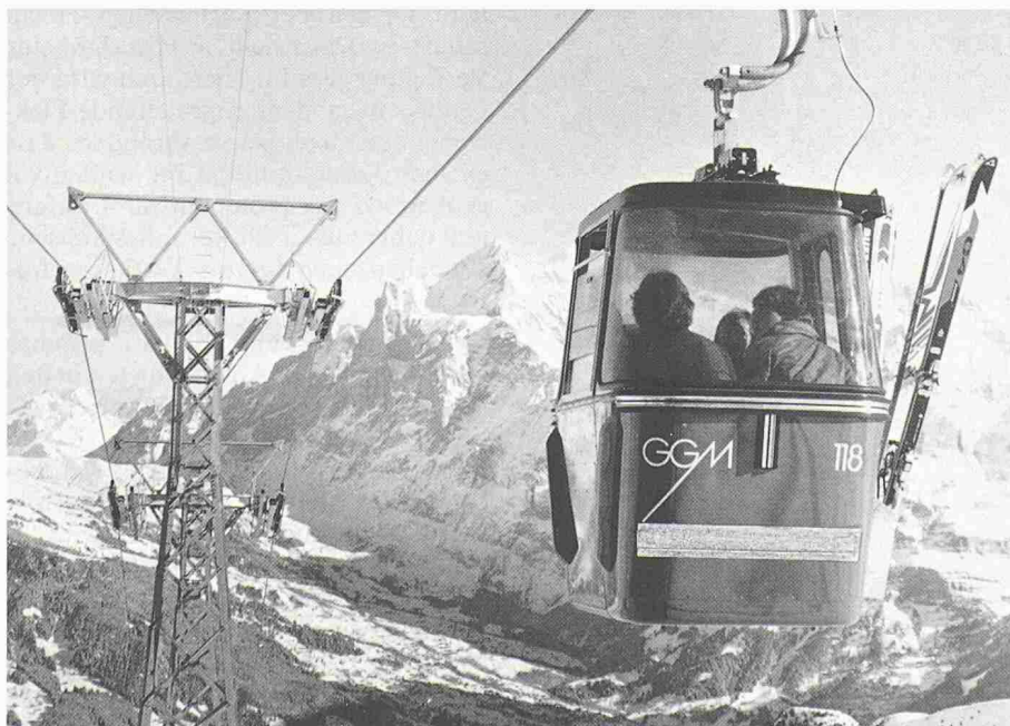
In den Skiferien verbrauchen wir rund zehnmals mehr Strom als daheim. Daraus resultieren sehr hohe Winterspitzen im Elektrizitätsbedarf der Winterkurorte

Angenommen wird bei dieser Berechnung, dass die Familie während der gesamten Feriendauer dreizehnmal in einem Mittelklasshotel übernachtet und an zwölf Tagen jeweils zehn Skiliftfahrten pro Tag absolviert. Aus diesem hohen Pro-Kopf-Verbrauch der Feriengäste resultieren die sehr hohen Winterspitzen im Stromverbrauch bei den Kurorten: In St. Moritz beispielsweise liegt die Nachfrage nach elektrischer Energie um die Jahreswende zwischen drei- und viermal höher als der Bedarf im «toten» Monat Mai.