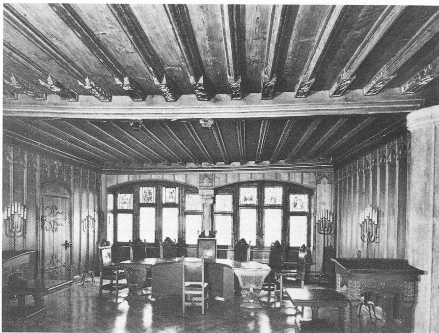
Salle de la Diète.

Le quartier des bains contraste par son calme avec le centre de la cité. Les curistes y sont accueillis dans des hôtels bien administrés et disposent notamment d'un centre médical. L'eau thermale doit sa célébrité à ses propriétés thérapeutiques favorables au traitement des affections rhumatismales et des séquelles d'accidents. Aux installations qui mettent en valeur cette eau (piscine thermale partiellement en plein air, bains individuels, gymnastique et massages par jet sous l'eau, etc.) s'ajoutent les équipements du domaine de la physiothérapie et de l'électrothérapie. Des représentations théâtrales de toute nature sont données au théâtre de la station. De petits groupes d'art dramatique et des cabarettistes se produisent au caveau du grenier érigé en maison des jeunes (Kornhaus). Des concerts symphoniques ont lieu au Kursaal. Des expositions itinérantes sont présentées dans diverses galeries d'art. La bibliothèque municipale met à la disposition du public une collection importante d'ouvrages littéraires et documentaires (environ 70 000 volumes).