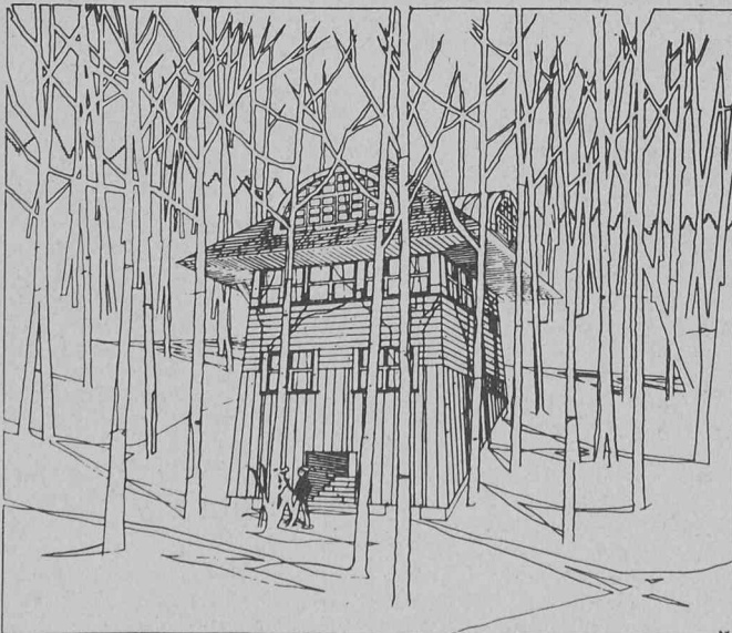
Venturi et Rauch: Brant-Johnson House, Vail (Colorado), 1976.

13 au 27 mai 1981: Venturi et Rauch, exposition du Kunstgewerbemuseum à Zurich réalisée par Stanislas von Moos. 10 au 25 juin 1980: Jacques Favre, architecte, 1921-1973. Décédé en 1973, Jac-