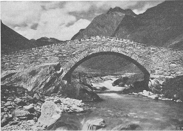
Abb. 9. Alte Brücke am Septimerpass (Graubünden). Plattiges Gestein lagerhaft verarbeitet, Rollschicht und dünne Abdeckplatte als Abschluss der Brüstung

nachher folgen die Rodung der Stöcke und die Erdarbeiten. Durch das Schutzwaldstreifen-Gesetz hat der deutsche Strassenbau die Möglichkeit, bis 40 m zu beiden Seiten des Baues neuen Wald, Waldsäume und weiche Uebergänge in sanften Böschungen zum bestehenden Walde zu bearbeiten. Sorgfältigem Beobachten und natursichtiger Einfühlung gelingt es dadurch, in ganz kurzer Zeit etwas Endgültiges hinzustellen, wie in Feld und Flur draussen, wo die blumige Wiese oder der Acker nicht durch steile Böschungen abgedrängt erscheinen, sondern ohne Wunden und Uebergänge dem Neubau angeschlossen werden.