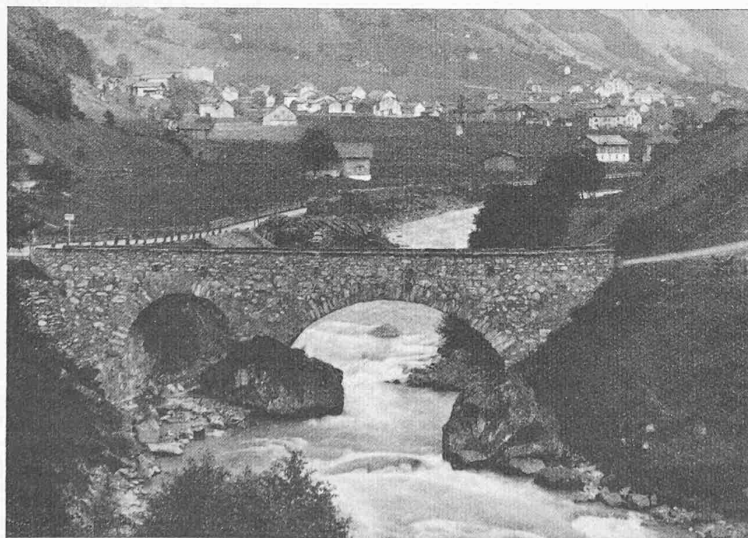
Abb. 8. Alte Sernbrücke bei Engi (Glarus). Vollkommene Einheit zwischen Bogen und Aufmauerung durch Ineinandergreifen der Steine, lagerhaftes Verarbeiten, glatte Ansichtsfläche

Aus jenen Massnahmen und der dadurch bewirkten Versteppung heraus entstanden jene Staubstürme, die den Ackerboden weghlisen, nicht nur in Amerika, sondern auch schon in Deutschland. In den U. S. A. aber hat bereits der Bodenerhaltungs-Dienst eingesetzt (Soil conservation service) und dort ist das Ziel, eine Landschaft zu erhalten oder neu zu schaffen, reich durchsetzt mit Wäldern, Büschen und Hecken, Tümpeln und Weihern, während wir in Störung des Gleichgewichtes der Natur diese nach und nach systematisch mit ungeeigneten Techniken und den Monokulturen vernichten.