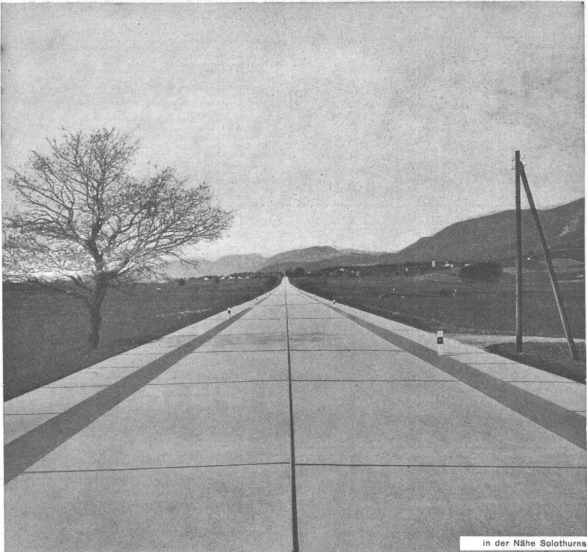
in der Nähe Solothurns