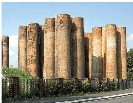
01 Die Biotürme in Lauchhammer erinnern an das Castel del Monte in Italien