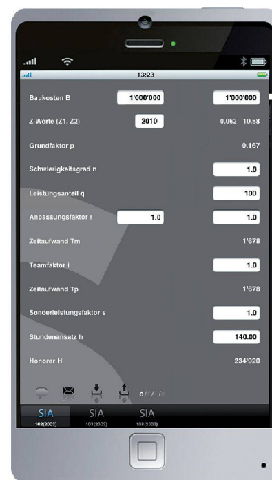
01 iPhone-Honorarrechner «siaFee»

sind. Die einmal erstellten Honorarprofile können abgespeichert und jederzeit auf dem iPhone weiterbearbeitet werden. Sie lassen sich auch per E-Mail auf den Computer exportieren, wo sie bequem in Microsoft Excel bearbeitet werden können.