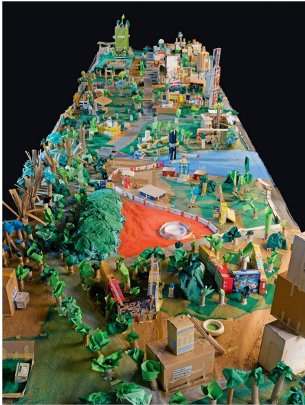
01 «Unser Stadtquartier», 1. bis 3. Klasse Aemtlerschulhaus Zürich

Obwohl die gebaute Umwelt unsere Gesellschaft nachhaltig prägt, steht Baukultur in der Schule höchst selten auf der Agenda. Um dies zu ändern und vor allem eine junge Öffentlichkeit für das Thema zu sensibilisieren, wurde 2008 der Verein «Spacespot» gegründet.