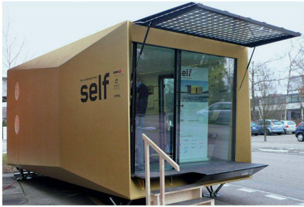
01 «Self» erprobt eine Reihe neuer Technologien im Praxiseinsatz

An der Swissbau wurde die Raumzelle «Self» vorgestellt: Sie versorgt sich selbst mit Energie und Wasser und bietet zwei Personen ohne grössere Komforteinschränkung Platz zum Leben und Arbeiten.