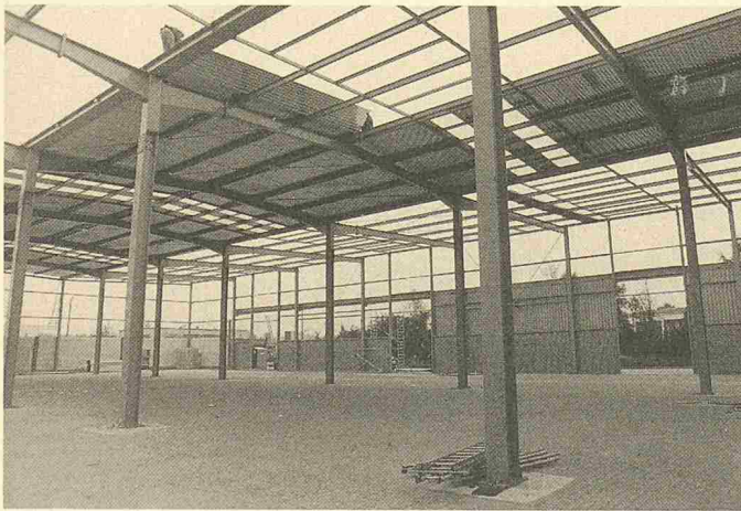
Fabrikhalle in Bremen: vollständig demontabel und wiederverwertbar

Korrugal Malkastenstr. 3 4000 Düsseldorf 1