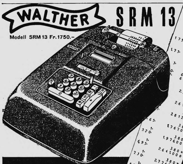
Modell SRM 13 Fr. 1750.-

Rédaction: Division du commerce du Département fédéral de l'économie publique, Berne