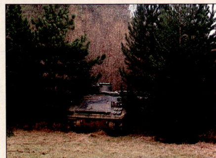
Ein M113 ungetarnt in einer Waldlichtung.

Die multispektrale Tarnung ist vor allem für Länder, die wie die Schweiz nicht a priori auf eine hohe Luftüberlegenheit zählen können und sich trotzdem gegen Aufklärung durch Satelliten, Flugzeuge und Drohnen schützen wollen, von grosser Bedeutung. Tarnung ist ein Schlüssel, um die Überlebensdauer von kostspieligen und komplexen Anlagen und Systemen signifikant zu erhöhen, ein Schlüssel zudem, dessen Kosten im Vergleich zu denjenigen der zu schützenden Objekte nur einen geringen Bruchteil ausmachen.