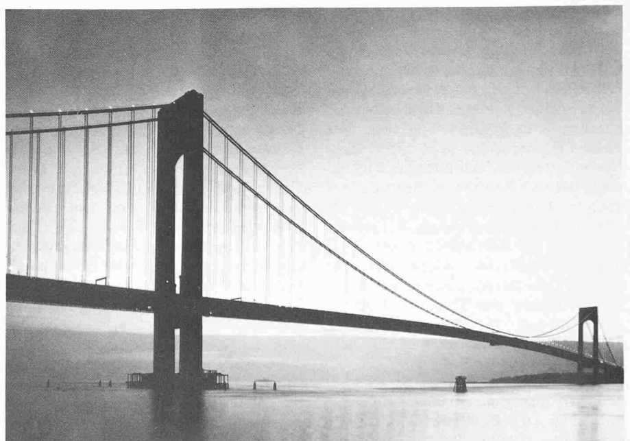
Verrazano-Brücke (1964), New York, Spannweite 1298 m

Nach einer kurzen Zeit der Ungewissheit setzten sehr bald die Anstrengungen zum Wiederaufbau der kriegsverwüsteten Länder ein. Es folgte ein anhaltendes Wachstum auf allen Wirtschaftsgebieten. Dabei wurden auch dem Brücken- und Hochbau grosse und oft neuartige Aufgaben gestellt. In den