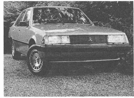
Entrée par la petite porte sur le marché européen, l'industrie japonaise s'attaque au domaine où les constructeurs du Vieux-Continent sont rois: la classe moyenne.

L'industrie automobile conserve un atout important: le fait que la voiture reste la grande passion de l'homme moderne, ainsi que le prouve sa stupéfiante progression dans notre société. De 1960 à 1976, la proportion des automobilistes par rapport à la population totale est passé de 8,3% à 28,4%. Mais le marché est maintenant proche de la saturation et la crise de l'énergie n'arrange apparemment pas les choses. Cependant, à plus long terme, elle ouvre aux constructeurs un nouveau «créneau»: désormais, c'est moins la quantité produite que la qualité obtenue qui sera le critère déterminant, en particulier sur le plan de la consommation de carburant. Préparer la voiture de demain: c'est la voie que doit suivre une industrie automobile européenne restructurée et reviv-