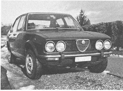
Alfa Romeo: un nom prestigieux, des qualités indéniabiles, une gestion discutable (des milliers de voitures vendues au-dessous du prix de revient), un environnement social troublé, une productivité minable. Le seul salut viendra-t-il du pays du Soleil-Levant?

millions d'Européens dépendent, directement ou indirectement, de l'automobile.