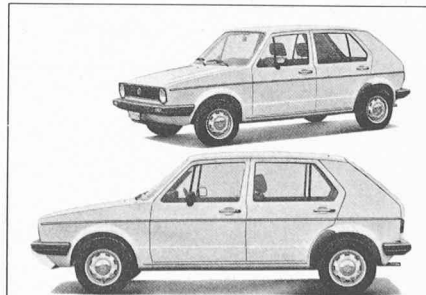
La concurrence japonaise et l'escalade du prix de l'essence ont conduit les grands constructeurs européens à rivaliser d'ingéniosité. Pourtant, les modèles qui ont vu le jour ces dernières années dans la classe des voitures petites et économiques ont nombre de points communs: traction avant, moteurs refroidis par eau (souvent montés perpendiculairement au sens de marche), abandon de la forme ponton, etc.

Ces changements doivent porter sur quatre secteurs clés: économies de dimensions, économies d'énergie, sécurité accrue, protection de l'environnement et, enfin, amélioration des méthodes commerciales.