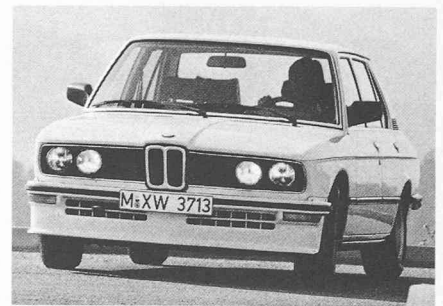
Aujourd'hui encore, les voitures «de haut de gamme» européennes se portent bien. Les acheteurs ne manquent pas pour des automobiles alliant confort poussé et technologie avancée. Pour combien de constructeurs y aura-t-il place demain? BMW (ci-dessus, BMW M535i) a pu éviter sa disparition, au début des années soixante, par l'introduction consécutive d'une technique d'avant-garde que lui ont empruntée depuis lors la plupart des constructeurs.