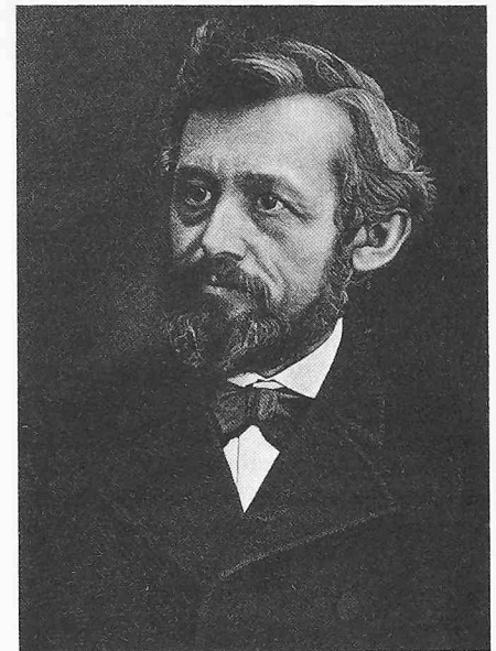
Carl Culmann (1821-1881), aus Festschrift zur Feier des fünfzigjährigen Bestehens des Eidg. Polytechnikums

Der Lehrbetrieb am Poly begann mit 31 Professoren (davon 14 auf Lebenszeit gewählt) und etwa einem Dutzend Hilfslehrern. Die maximale Besoldung für einen Lebenslänglichen (meist Ausländer) betrug 5000 Franken, während die anderen mit weniger vorliebnehmen mussten. Immerhin, «so wenig glänzend die Bedingungen waren, die der schweizerische Schulrat den Lehrern des Polytechnikums bieten konnte, so glänzend war doch der von ihm zusammengebrachte Lehrkörper, wozu allerdings die misslichen politischen Verhältnisse der Nachbarstaaten reichlich beigetragen hatten. Welch stolze Vereinigung von Technikern und Gelehrten ersten Ranges war da in den Semper, Culmann, Wild, Zeuner, Reuleaux, Bolley, Clausius, Heer, Nägeli, Escher von der Linth, Wolf, Vischer, De Sanctis, Burckhardt beisammen! Mit Recht ist gesagt worden, dass «seit der Gründung der Universität Berlin keine höhere Unterrichtsanstalt mit einer solchen Fülle ausgezeichneten Lehrkräfte eröffnet worden ist, wie das eidgenössische Polytechnikum». Cul-