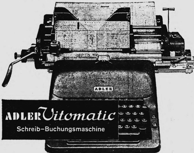
ADLER Vitomatic Schreib-Buchungsmaschine

Mit verbundenen Augen können Sie die Kontenkarte schreibfertig, zeilengerade und auf die richtige Buchungszelle einstellen. Kein Richten — ein Hebelzug genügt!