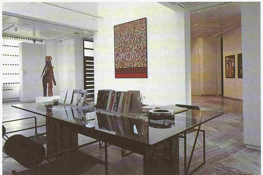
Ein Blick in die Räume der «Galleria Gottardo»