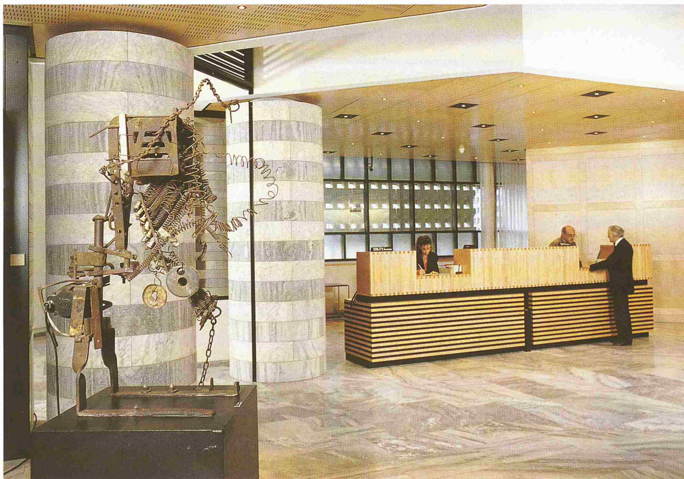
Tinguelys Eisenplastik «Totem IX» steht beim Eingang der Schalterhalle des neuen Hauptsitzes der Gotthard Bank in Lugano

Die Zeiten ändern sich und wir uns mit ihnen. Die neue junge Generation sieht die Thematik deutlich toleranter. Das Sponsoring ist allüberall, d.h. in allen Sparten, eine finanzielle Not-