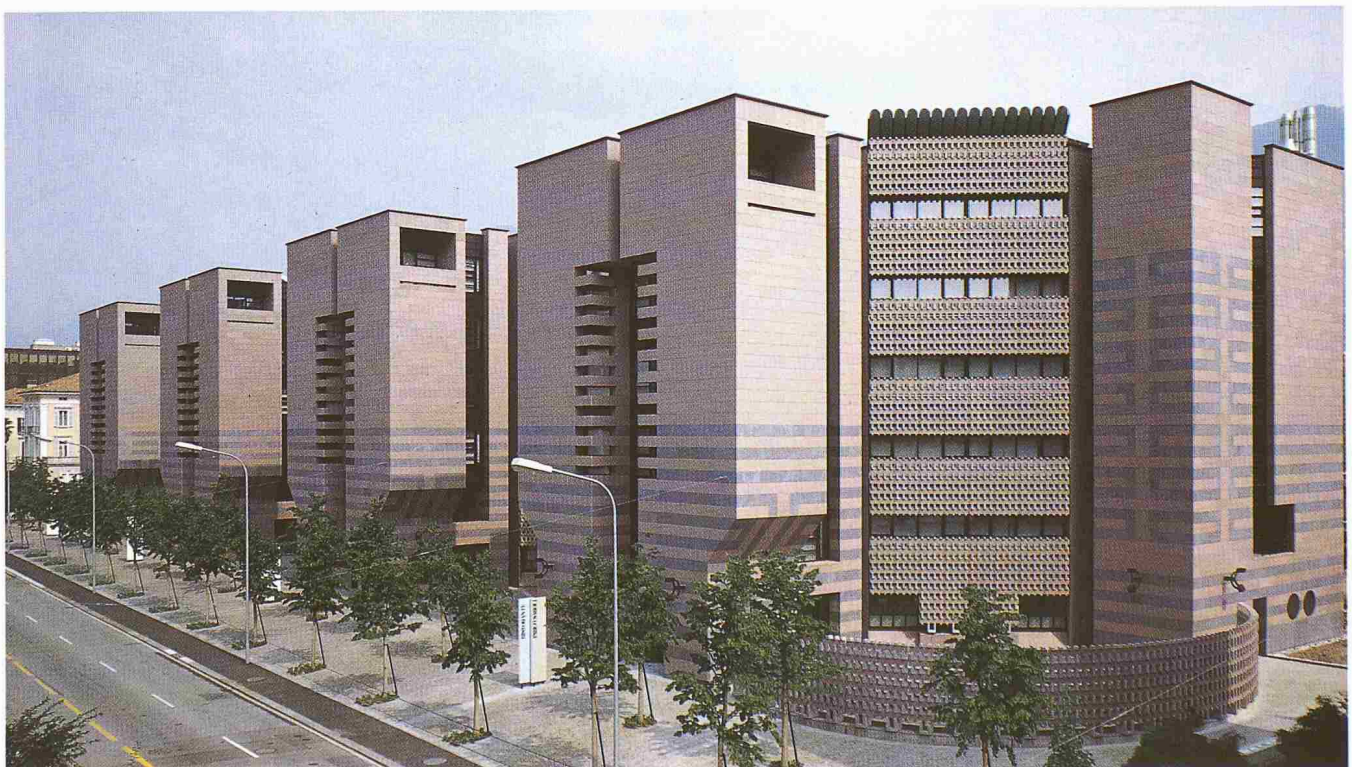
Die Hauptfront der Banca del Gottardo in Lugano, ein Botta-Bau, der im November 1988 eingeweiht wurde