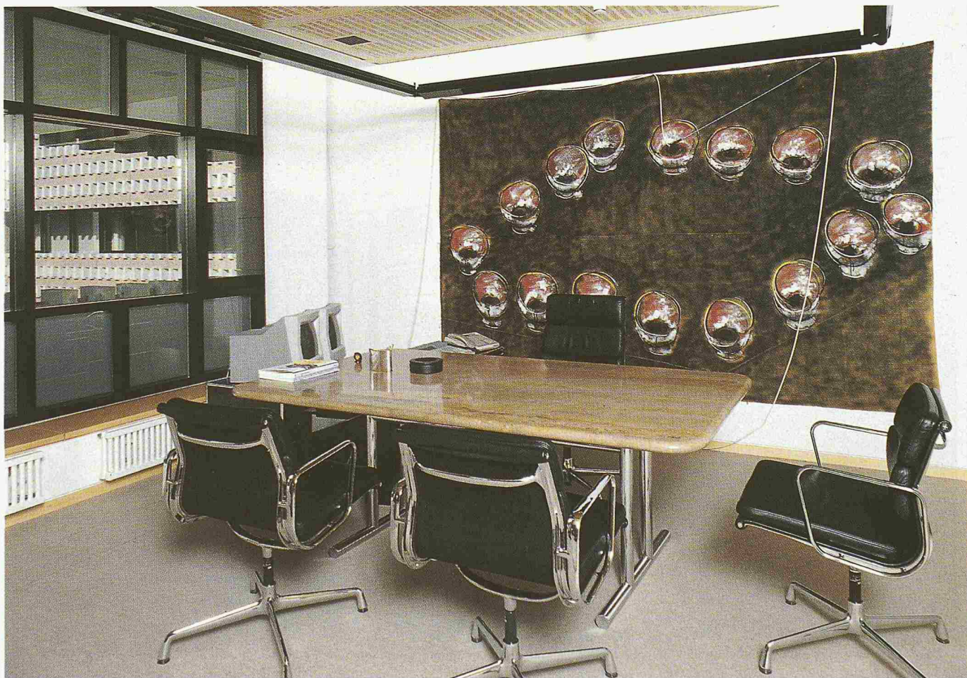
Dominierend in einem Direktionsbüro: die «Tazze die Torino» von Mario Merz