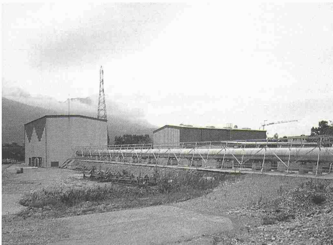
Bild 1. Die 75 m lange, magnetische, abgeschirmte Flugstrecke, in der sich die Neutronen in Antineutronen umwandeln können, führt zum Detektor, der die Antineutronen registriert

Die gesamte Anordnung ist so ausgelegt, dass noch Zeitkonstanten bis zu 3 Jahren für die Neutron-Antineutron-Oszillation, d.h. 10 Ereignisse pro Jahr messbar sind.