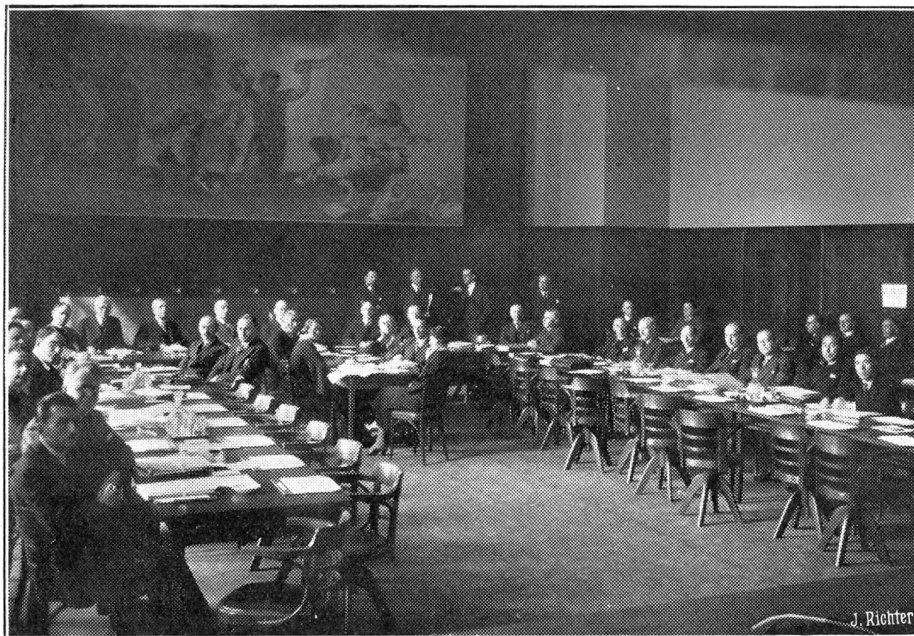
Sitzung der Rohstoffkommission in Genf.