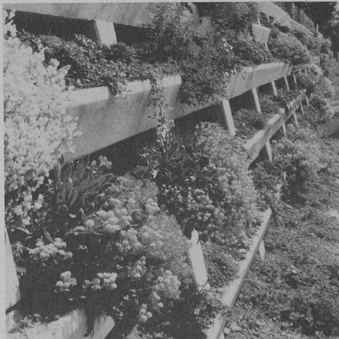
Detail aus einer bepflanzten Stützmauer