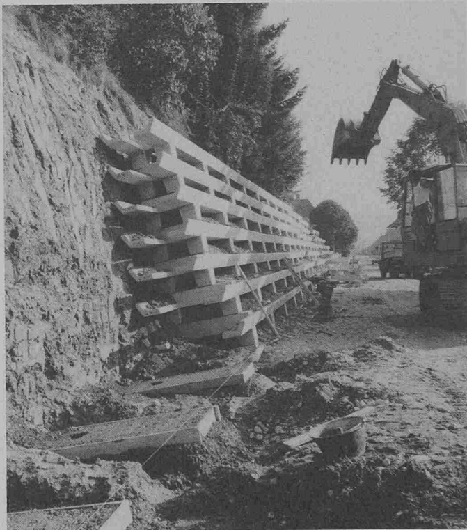
Bau einer Stützmauer an der Staatsstrasse Walkringen (BE)

Wachstums Voraussetzungen sind deshalb besonders gut, weil die grossen Erdkammern die Pflanzen im Wachstum nicht einschränken und andererseits die Längsträger winkelförmig ausgebildet sind. Die Feuchtigkeit im dahinter liegenden Erdreich ist dadurch gegen Fahrwind und gegen Sonne besser geschützt. Um den Unterhalt der Pflanzen auf ein Minimum zu vermindern, werden mit Vorteil widerstandsfähige, bodenbedek-