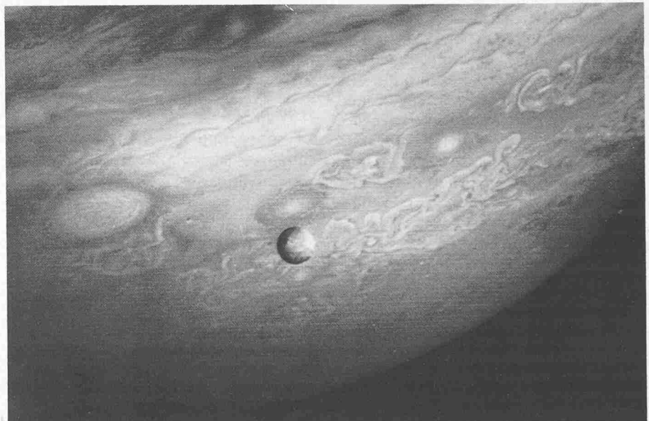
Der wohl aktivste Himmelskörper unseres Sonnensystems ist der Jupiter-Mond Io – hier von der amerikanischen Raumsonde Voyager 2 aus ungefähr 12 Millionen Kilometer Entfernung vor der turbulenten Gashülle der südlichen Hemisphäre Jupiters fotografiert. Bei heftigen Vulkanausbrüchen auf Io, er ist etwa so gross wie der Erd-Mond, werden winzige Ascheteilchen ausgeworfen, die auf Umwegen den Ring um Jupiter verursachen

Winzige Teilchen mit Radien kleiner als ein Zehntel Mikrometer (1 Mikrometer = 1 Zehntausendstel Zentimeter) in der Vulkanasche haben jedoch, so berechneten Grün und Morfill, durchaus eine Chance, den Anziehungsbereich Ios zu verlassen. Sobald die Staubpartikel nämlich über die dünne, bis in ungefähr 100 Kilometer Höhe reichende Atmosphäre Ios hinausgeschleudert werden, laden sie sich innerhalb von Sekunden elektrisch auf. Das geschieht entweder durch das Ultraviolett-Licht der Sonne (Photoeffekt) oder – dieser Prozess dürfte vorherrschen – durch das Bombardement energiereicher Plasmateilchen, die in den starken Strahlungsgürteln des Magnetfeldes um Jupiter eingeschlossen sind. Wie die Erde, weist nämlich auch der Jupiter eine weit in den Weltraum hinausreichende Magnethülle auf,