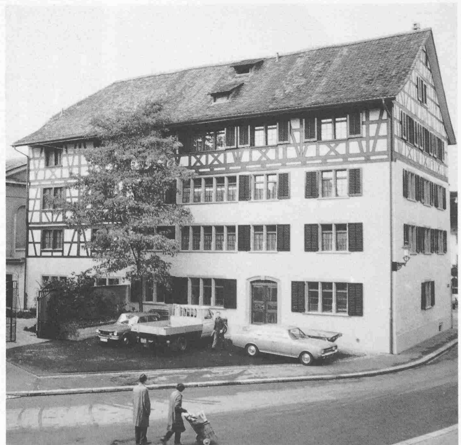
Die Ostfassade vor der Restaurierung