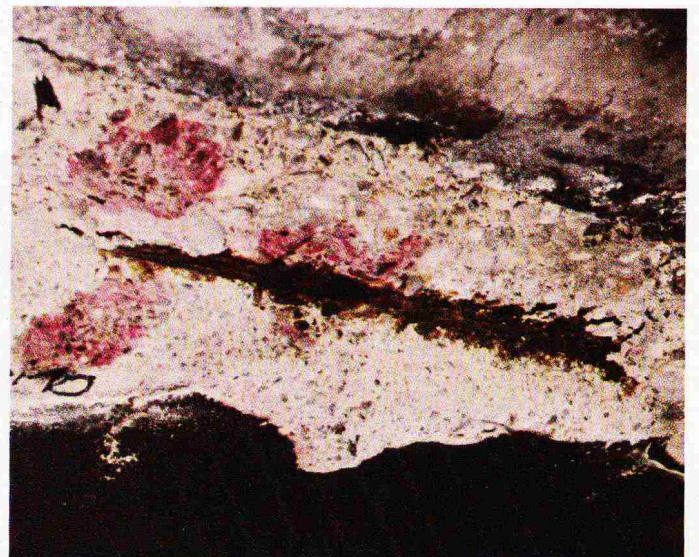
Brücke C. Die Resthaftung (rote Zone) dieser abgedrückten Betonüberdeckung war die Ursache, dass dieser Zustand bis zum Tage der Untersuchung unbekannt blieb