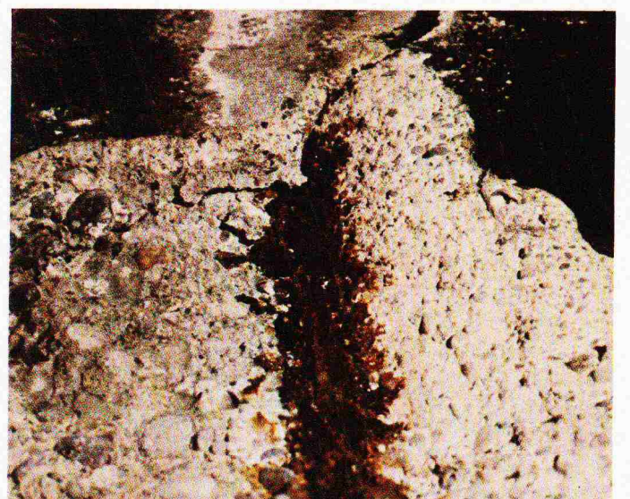
Brücke C. Die Stahleinlage von 30 mm Durchmesser besteht nur noch aus Eisenoxid!