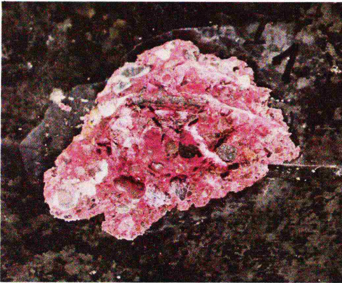
Brücke A. Keine Spur von Karbonatisierung im Alter von 42 Jahren! Der Verbund zwischen Stahleinlage und Beton ist gesund