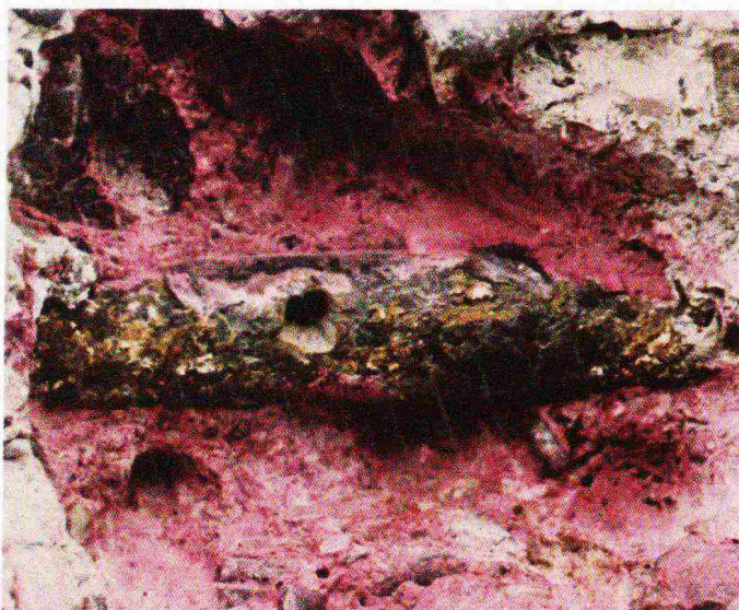
Brücke C. Der untere Drittel dieses Armierungseisens wurde durch die Karbonatisierung erreicht und die beginnende Oxidation bewirkt bereits eine Trennung von Eisen und Beton