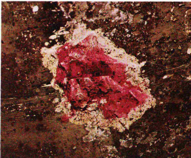
Brücke B. Die rote Färbung von Beton und Eisen zeigt, dass die Stahleinlage noch vollständig in der alkalischen Zone des Bauwerkes liegt