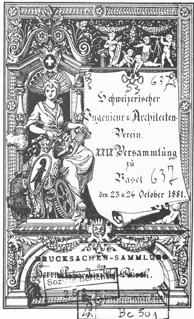
Einladung zur 29. Versammlung des Schweizerischen Ingenieur- und Architekten-Vereins nach Basel am 23./24. Oktober 1881 (Bild oben und gegenüberliegende Seite). Auf dem Programm stand als Festgruss eine «Dramatische Scene» des Architekten Paul Reber, die im Stadttheater Basel aufgeführt wurde. Es handelt sich um eine Auseinandersetzung zwischen den Geschwistern Ingeniora und Architectura unter den Fittichen der Basilea

Internationale Weltkraftkonferenz eine Teiltagung nach Basel einberief, hatte es der SIA nicht zu bereuen, seine Jahresversammlung 1926 nach Basel angesetzt zu haben. Die nur kurze wirtschaftliche Konjunkturperiode der zwanziger Jahre liess der Schweiz und der damals als «Goldenes Tor der Schweiz» genannten Stadt Basel, die Zukunft in rosigen Farben erscheinen, so dass das von Ingenieur August Burckhardt für diese Versammlung verfasste Theaterstück eines optimistischen Zukunftsgemäldes für das Jahr 1950 grossen Anklang fand.